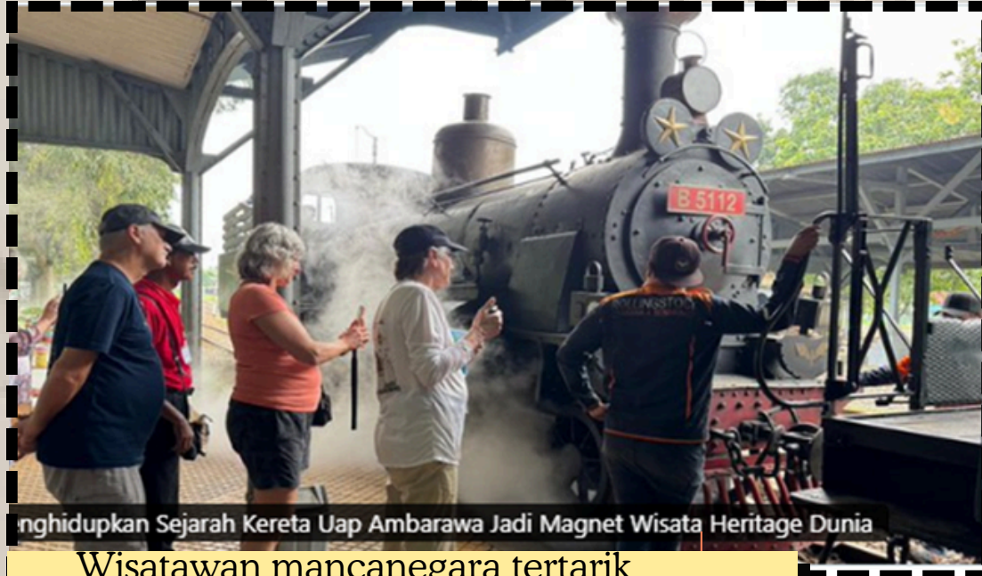
Menhidupkan Sejarah Kereta Uap Ambarawa Jadi Magnet Wisata Heritage Dunia

Wisatawan mancanegara tertarik dengan museum kereta api